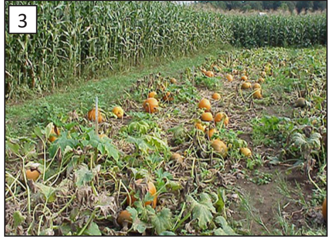
FIGURA 2. BAJO CONDICIONES DE HUMEDAD, SE PUEDE OBSERVAR EN EL ENVÉS DE LAS HOJAS LA ESPORULACIÓN DEL PATÓGENO DE COLOR GRIS OSCURO A PÚRPURA. FIGURA 3. EL MILDIÚ VELLOSO DE LAS CUCURBITÁCEAS PUEDE AVANZAR RÁPIDAMENTE A TRAVÉS DE UNA PLANTACIÓN, RESULTANDO EN DEFOLIACIÓN Y LA MUERTE DE LAS PLANTAS.

la muerte completa de la planta en cuestión de días (FIGURA 3). Los frutos de las cucurbitáceas no están infectados por el patógeno, pero el rendimiento disminuirá debido a la pérdida de hojas y la consiguiente reducción de la fotosíntesis.