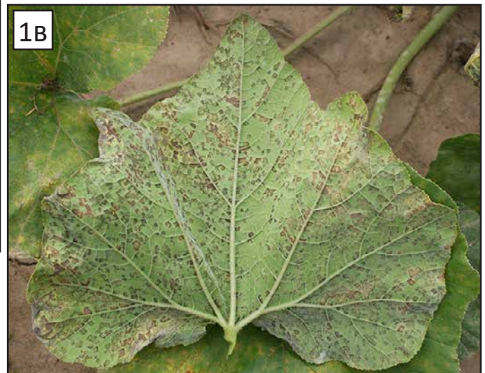
FIGURA 1. LOS SÍNTOMAS DEL MILDIÚ VELLOSO DE LAS CUCURBITÁCEAS COMIENZAN COMO MANCHAS AMARILLAS PÁLIDAS A BRILLANTES QUE VAN ADQUIRIENDO UNA FORMA IRREGULAR O “EN BLOQUE” (A). LAS MANCHAS SE DISPERSAN A TRAVÉS DE LA PLANTA Y SE CONVIERTEN EN LESIONES NECRÓTICAS (B).